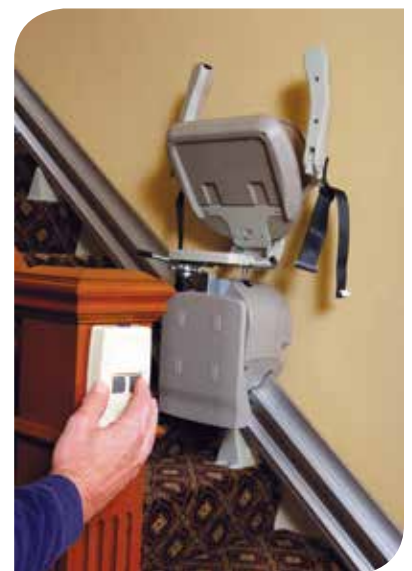
Deux télécommandes d'appel sans fil.