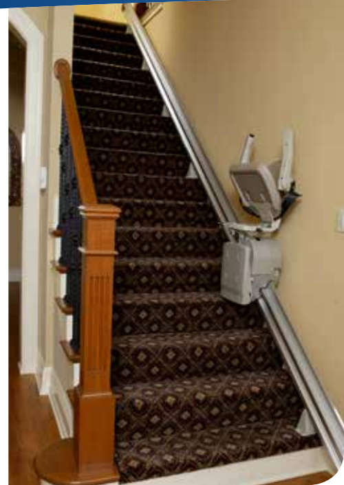
Modèle compact rabattable peu encombrant.

Pour en savoir plus, rendez-vous sur www.bruno.com