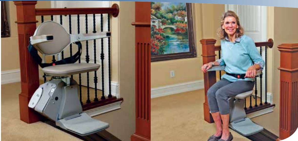
Le siège à pivot décalé facilite l'accès.